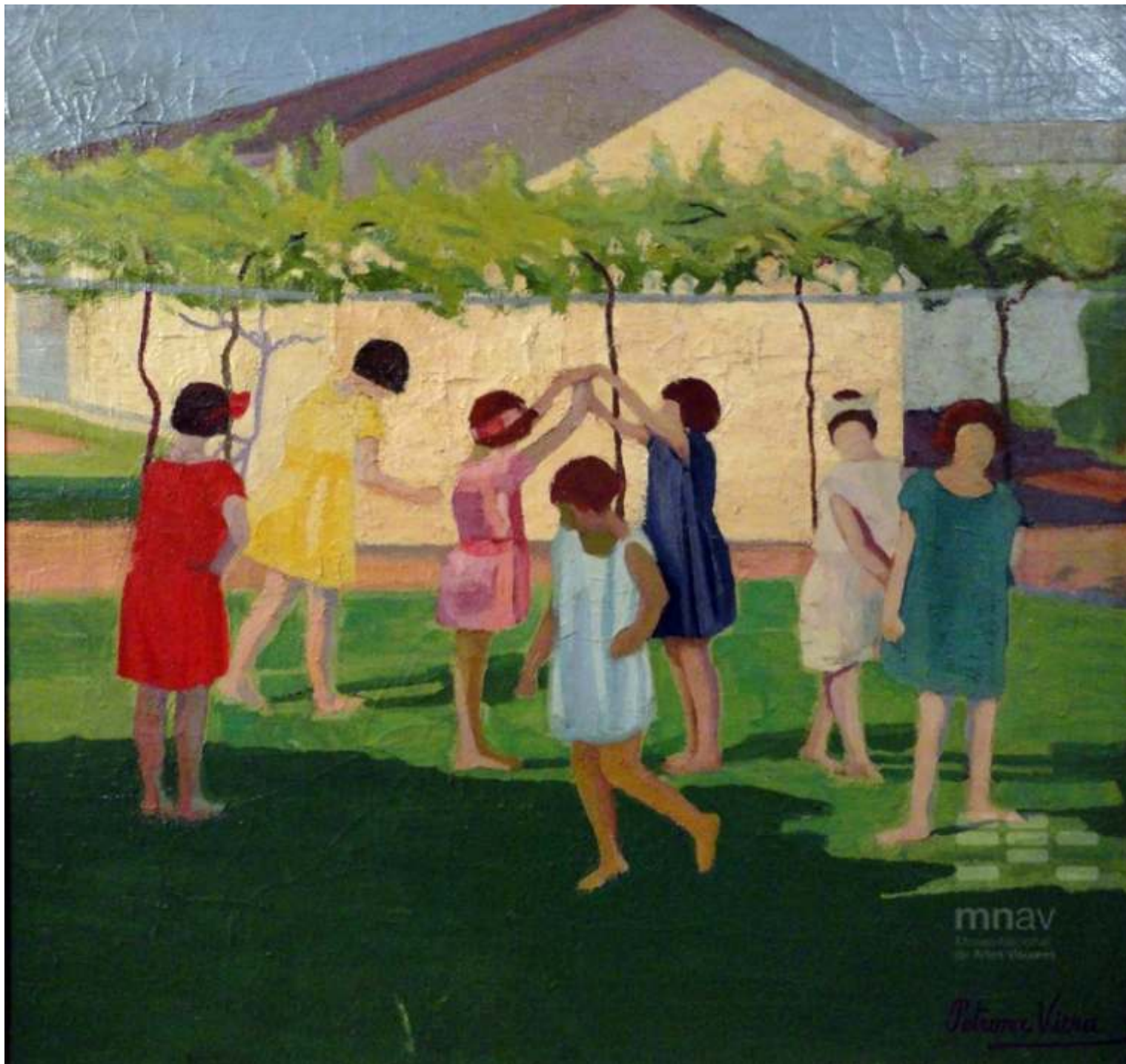
Recreo Petrona Viera (1895-1960) c.1924 Óleo sobre tela 86 x 90 cm