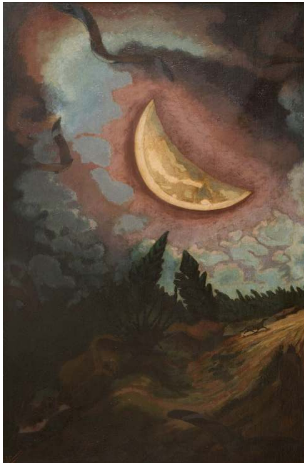
Luna con dormilones José Cuneo (1887-1977) c.1944 Oleo sobre madera 146 x 97 cm