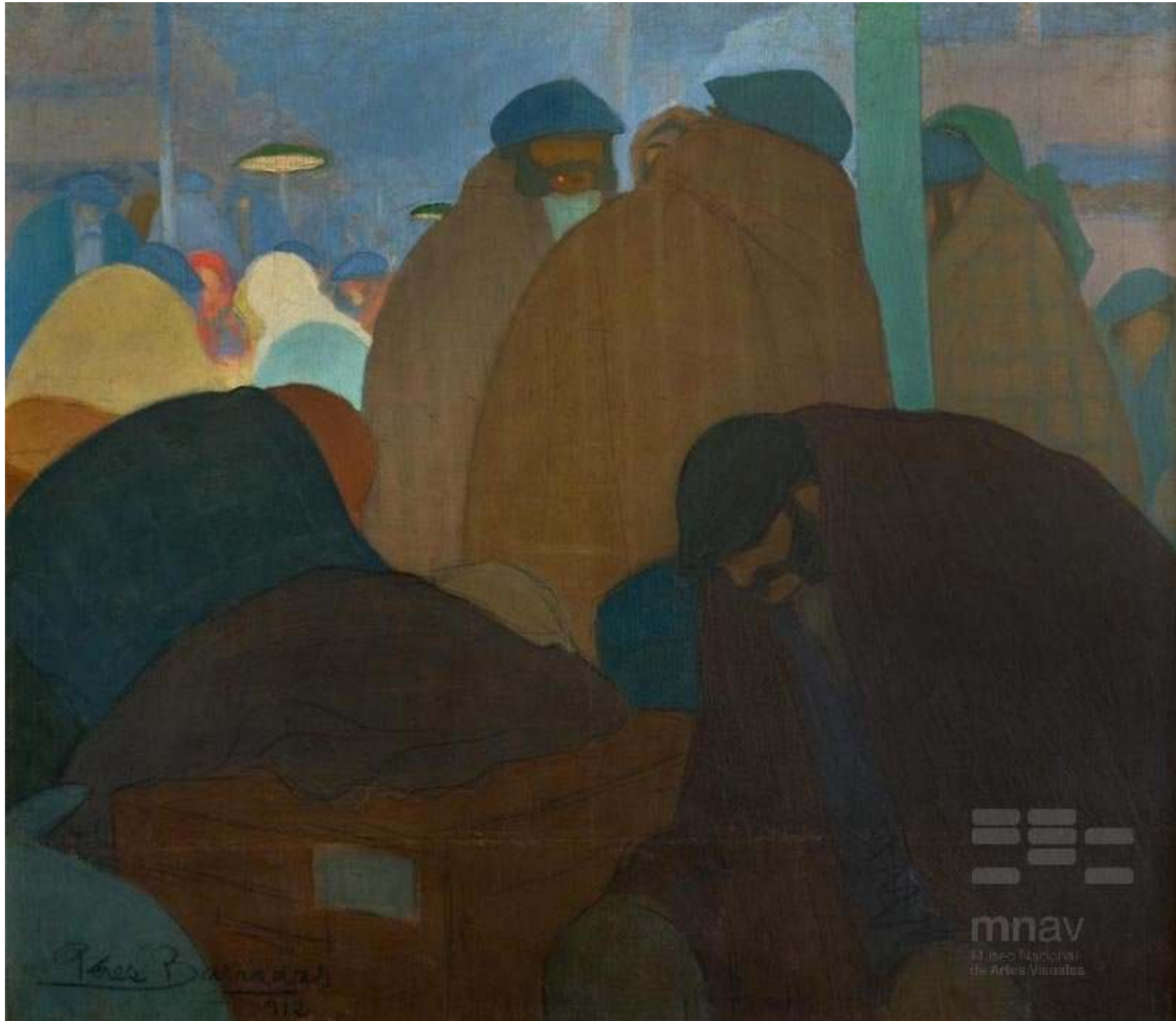
Los emigrantes Rafael Barradas (1890-1929) 1912 Óleo sobre tela 121 x 140 cm