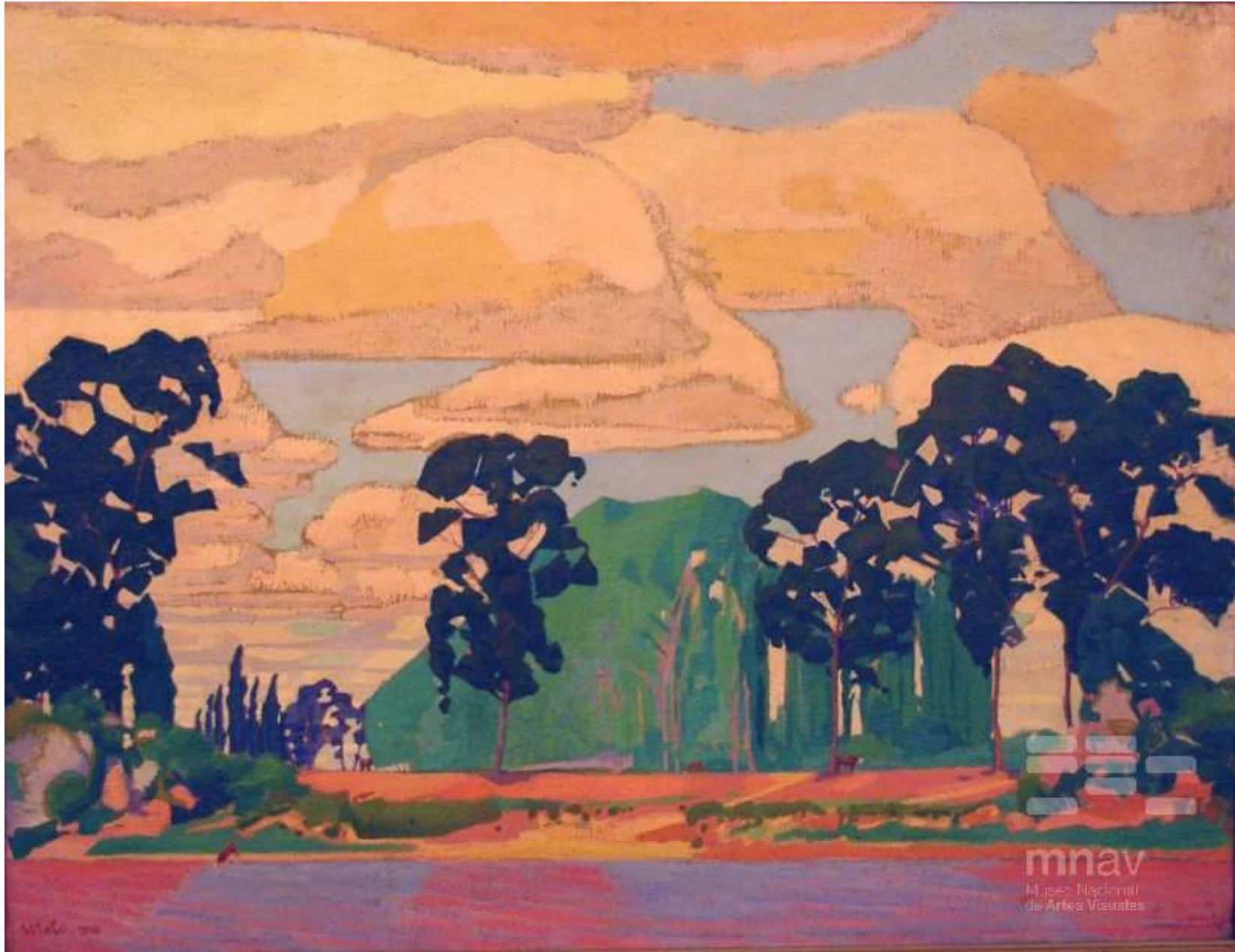
Cerro Largo (La Aguada) José Cuneo (1887-1977) 1918 Óleo sobre tela 100 x 132 cm