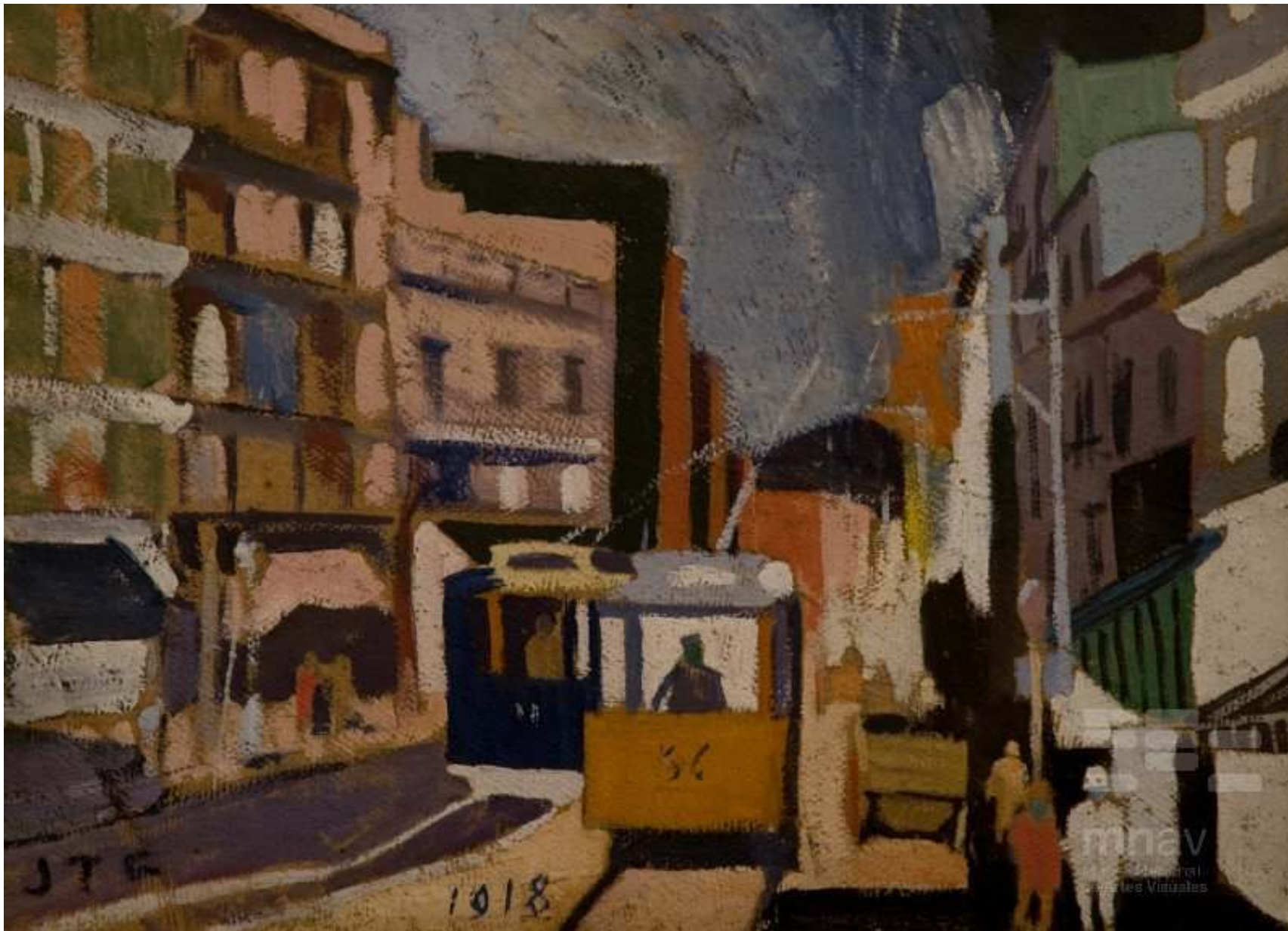
Paisaje de ciudad Joaquín Torres García (1874-1949) 1918 Óleo sobre cartón 36 x 56 cm