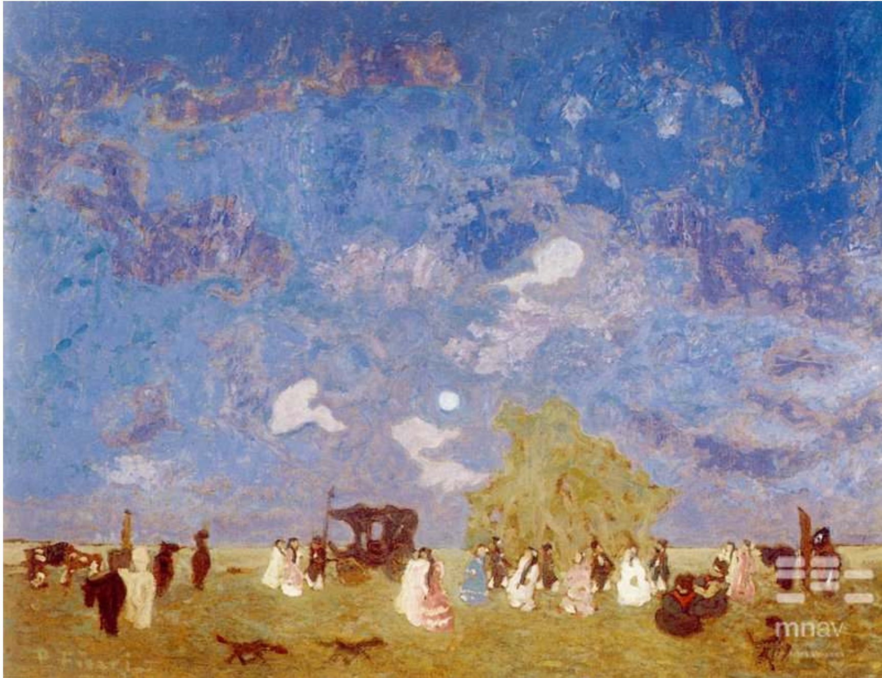
Pique nique Pedro Figari (1861-1938) c.1925 Oleo sobre cartón 65 x 88 cm