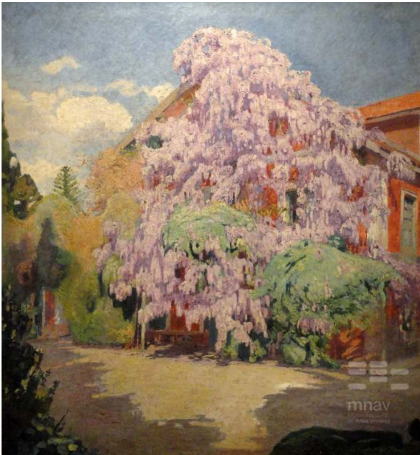
Las glicinas Pedro Blanes Viale (1878-1926) 1923 Óleo sobre tela 130 x 120 cm