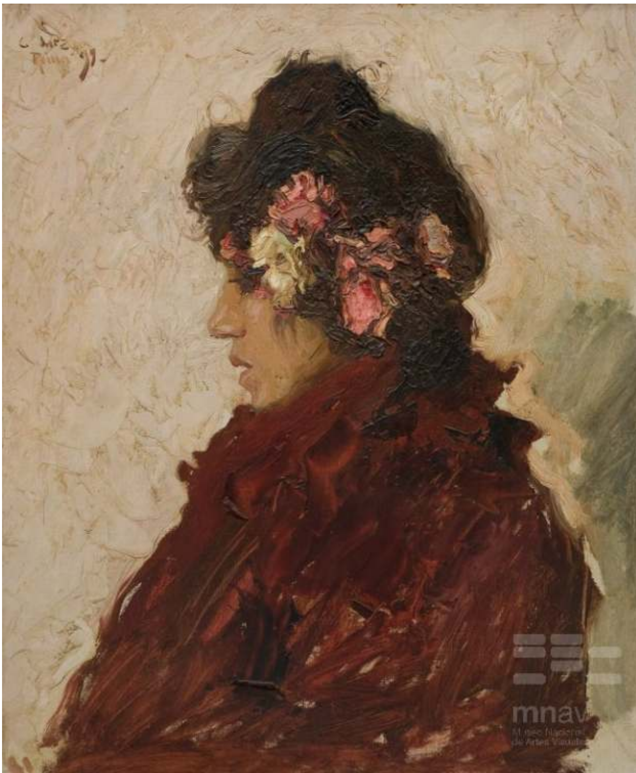
Estudio Carlos Federico Sáez (1878-1901) 1899 Óleo sobre tela 65 x 54 cm