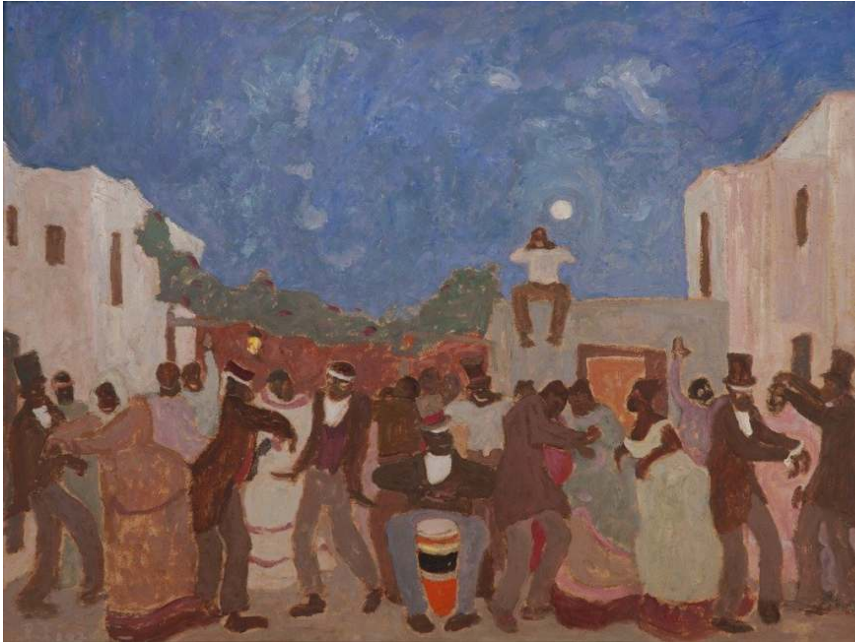
Candombe Pedro Figari (1861-1938) c.1925 Oleo sobre cartón 62 x 82 cm