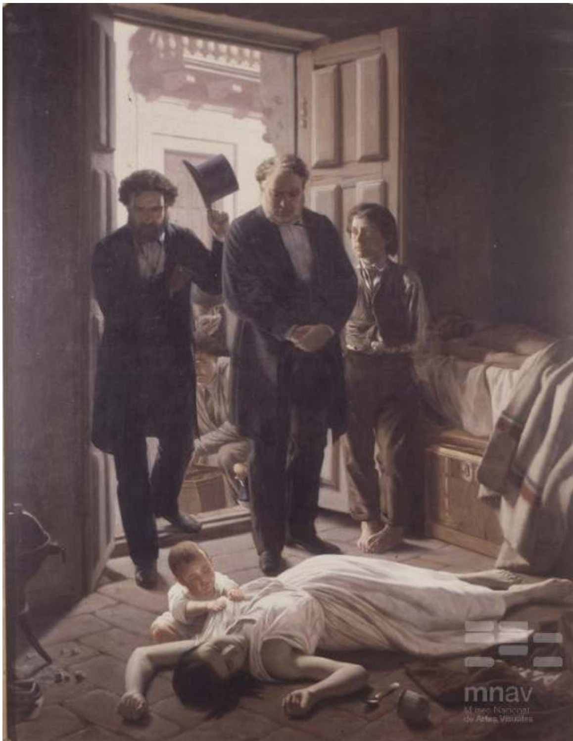
Un episodio de la fiebre amarilla en Buenos Aires Juan Manuel Blanes (1830-1901) c.1871 Óleo sobre tela 230 x 180 cm