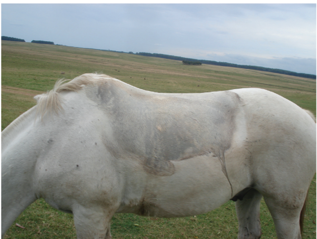
Sudor. Fotografía digital, 2010.