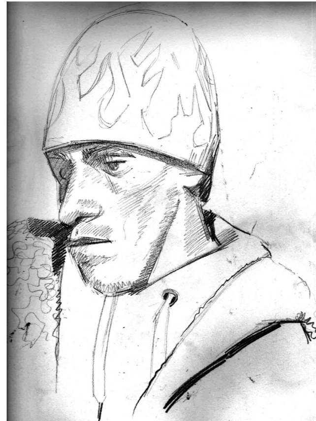
Joven de Tranqueras. Carbonilla sobre papel, 21 x 29,7 cm. Tranqueras, 2010.