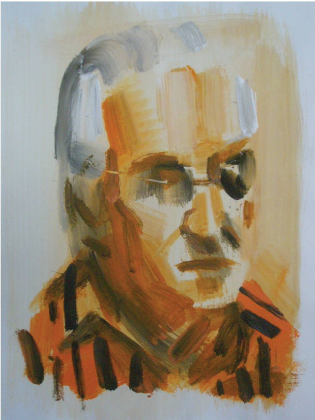
Habitante de Minas de Corrales. Acrílico sobre papel, 43,4 x 29 cms. Minas de Corrales, 2010.