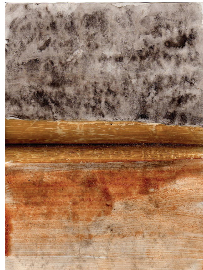
El Laboratorio Color y Contexto, se propone producir colores, pigmentos, pinturas y tintas utilizando materiales provenientes del lugar estudiado. Estudio de pigmentos naturales. Tierras rojas y amarillas de Tranqueras sobre cuaderno de manufactura casera con tapas de cartón gris. Tranqueras, 2010.