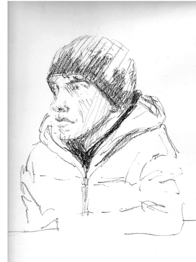
Joven de Tranqueras. Carbonilla sobre papel, 27 x 42 cm. Tranqueras, 2010.