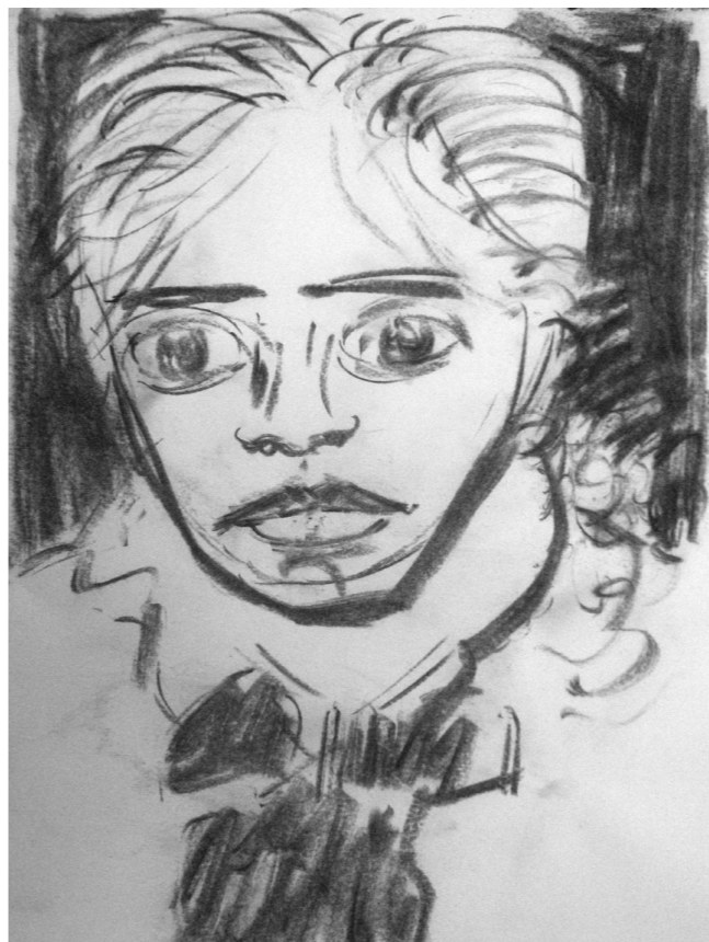
Estudio de escolar. Carbón (recogido en el fuego de la parrilla en la que cocinábamos y calentábamos hasta el agua del mate mientras pernoctamos en las ruinosas instalaciones de la ex Escuela Agraria de Tranqueras) sobre papel, 43,4 x 29 cm. adquiridos en Montevideo. Tranqueras, 2010.