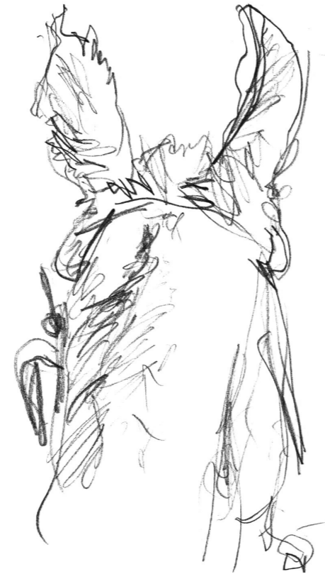
Estudio de un caballo andando sobre el caballo. Lápiz sobre papel, 13,4 x 19 cms. Algún lugar entre Minas de Corrales y Tranqueras, 2010.